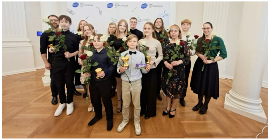
Autasustatud Räpina Muusikakooli õpilased ja õpetajad.