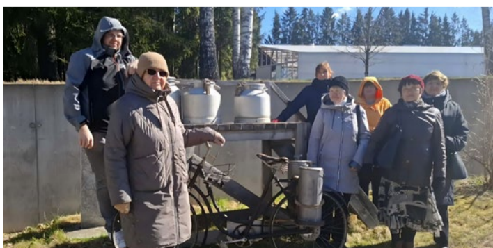
Äratundmisrõõmu pakkus tee kõrval olev piimapukk.

Suur tänu Eesti Maantee-muuseumile mitmekesise väärikate programmi ja Leevi rahvamajale ekskursiooni organiseerimise eest!