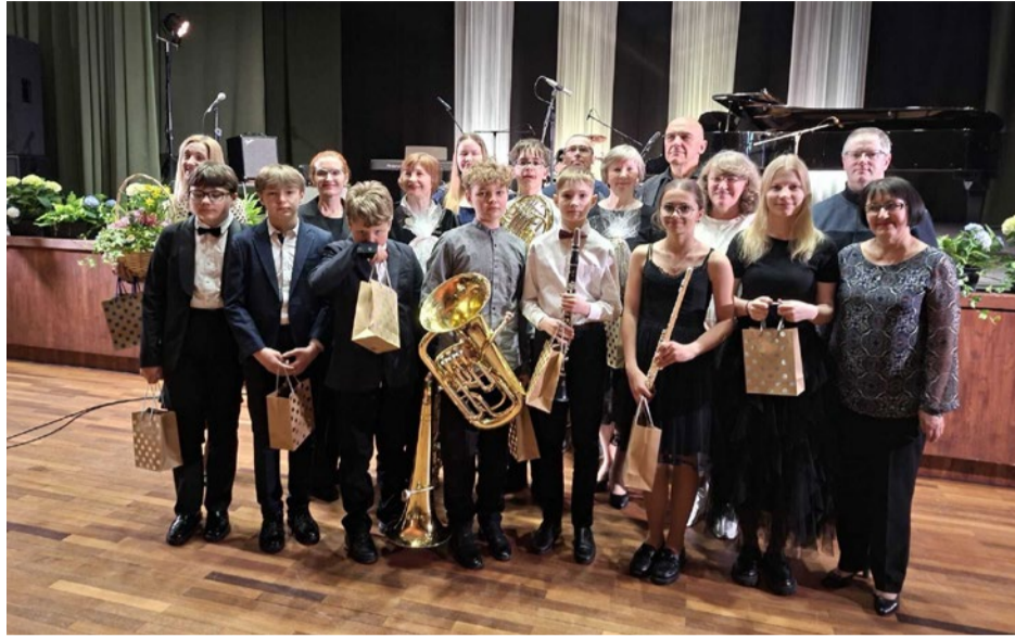
Gulbene külalised pärast õnnestunud kontserti.