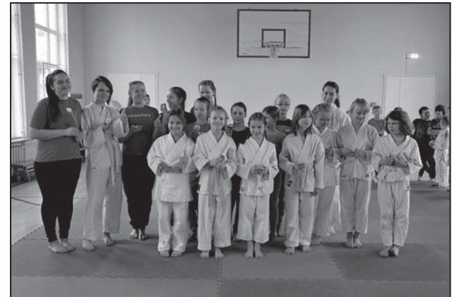
Rokkivad tüdrukud suhkruilidega.