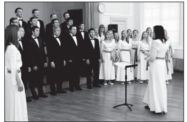
Üliõpilassegakooriga XX Eesti segakooride võistlusalmsel Tartus.