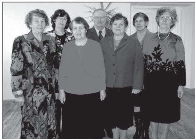
Pensionäride Seltsi uus juhatus.