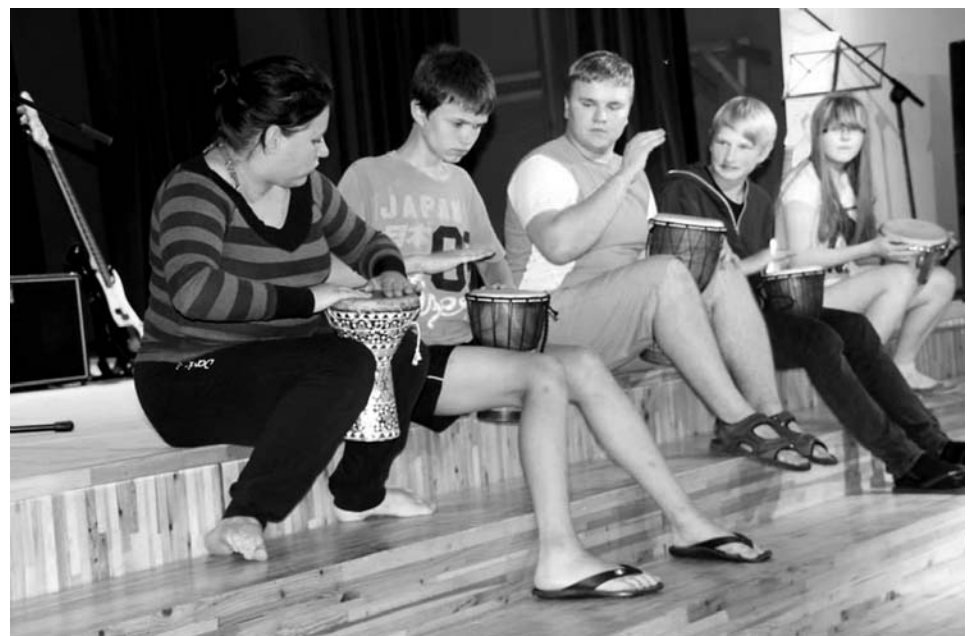
Räpina Avatud Noortekeskus osales rahvusvahelises noortevahetuse programmis.