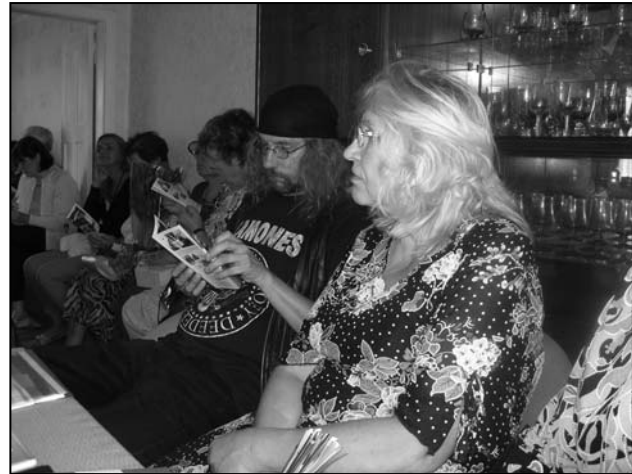
Külalised voldikut uurimas.