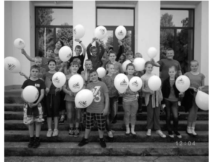
Räpina – hea kodu koht.