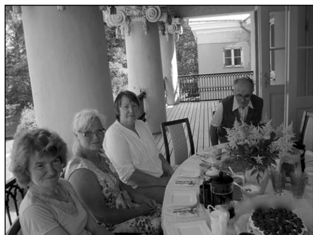
Looduskaitsejad nautisid kokkutulekut mõnuses rõdukohvikus.