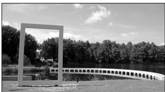
National Geographicu kollane aken Räpinas.