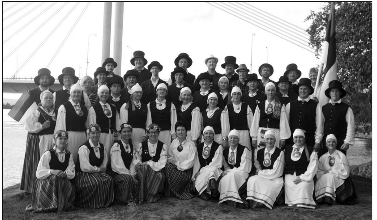
Segarahvatantsurühmad Reilender ja Helgerid osalesid rahvusvahelisel folkloorifestivalil „Jutajaiset“ Soomes.