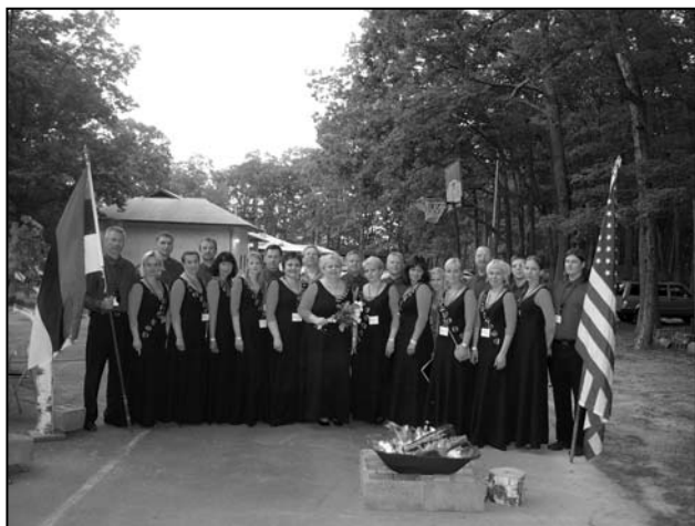
Räpina Kammerkoor Ameerikas.