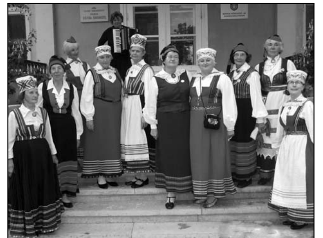
Toredad saare naised Rápinas.

Saatsin neid Puuriida pubisse sööma, naistel suur hirm vihma pärast, kui seelikud saavad märjaks, siis on plissee sirge ja teha pole enam midagi. Selgus, et ka raha pole neil kaasas. Ütlesin seepeale, et nad jäetakse siis Rápinasse tööle. See aga ei tulnud kõne allagi, sest laupäeval peeti Põlva Intsikurmus vabadusvõitlejate päeva ja see saarlaste peaeasmärk oligi. Saaremaa ansambel on Kuressaarest, aga mehed veel mitmel poolt mandriit.