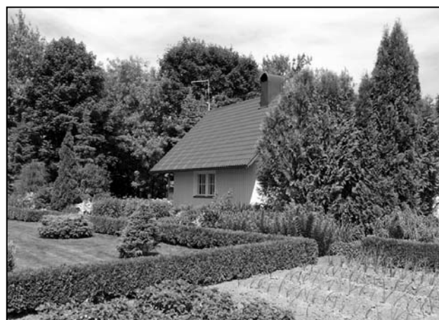
Hiie maakodu Sillapää külas.

Räpina valla haridus- ja kultuurispetsialist