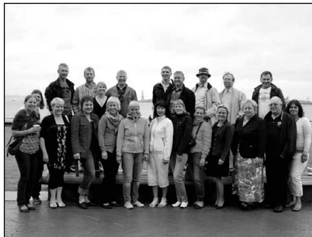
Keskel miss Liberty.