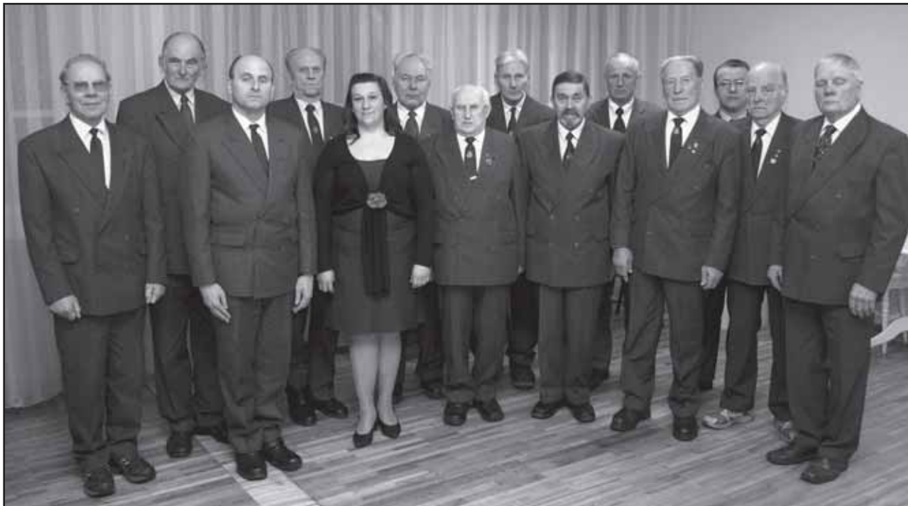
Rāpina meeskoor juubelihooajal.