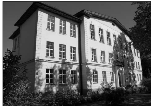
Vijaka kaunemaid koolimaju.