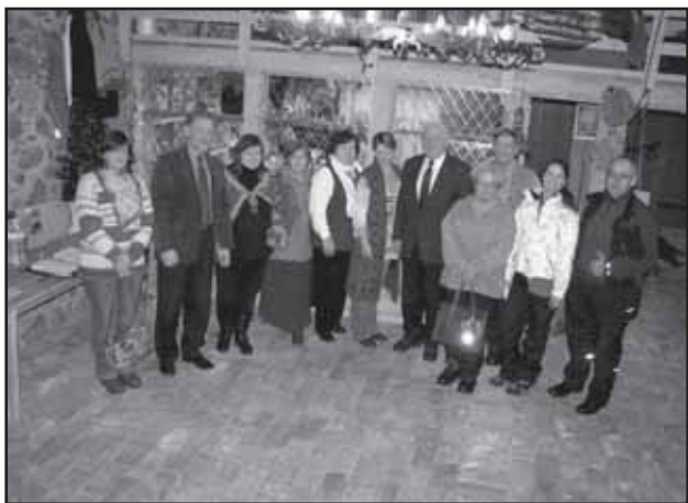
Ringreisieltskond koos võõrustajatega Uhti kõrtsis.