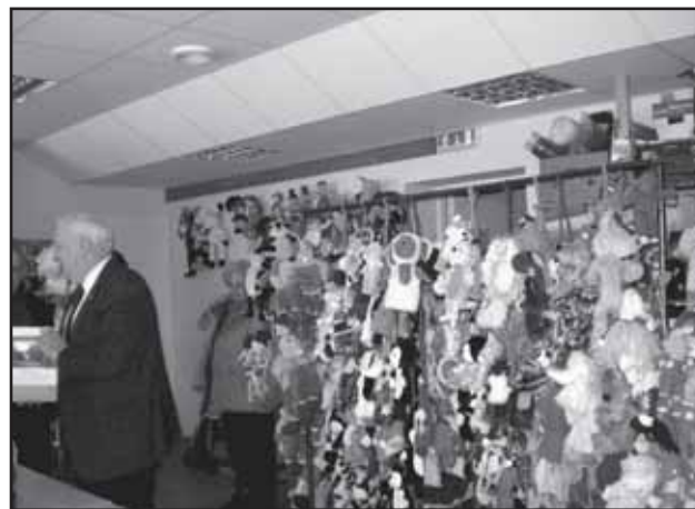
Võrus Aila Näpustuudios on väljapanek laste valmistatud käpiknukkudest.