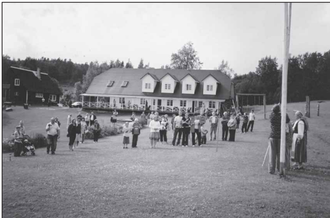
Lipu heiskamine Vasknas 9. augustil 2008