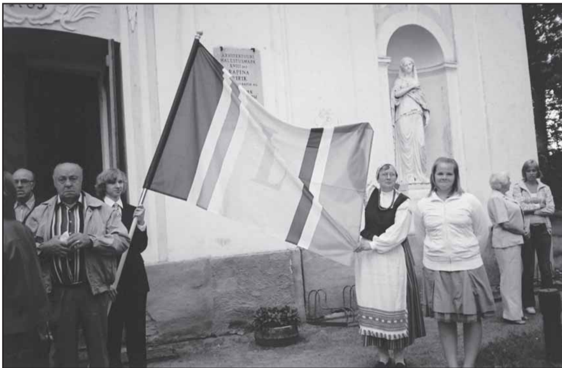
Lipu õnnistamine 9. augustil 2008 Räpina Miikaeli kirikus