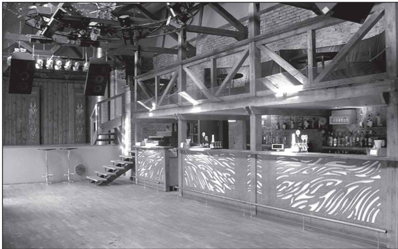
Ööklubi TEINE KODU