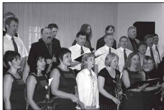
Kammerkoor muutus koos endiste lauljatega võimsaks segakooriks.