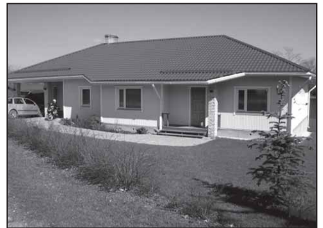
Eeskujulikult heakorrastatud koduümbruse eest 2007. a mastivimpli saanud perekond Zupsmanni eramu.